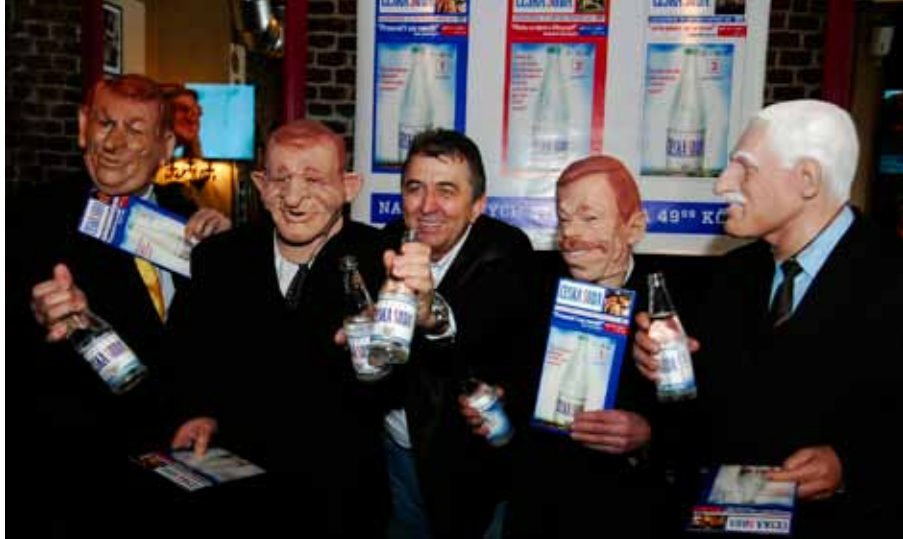
▲ Gumáci v maskách politiků Zemana, Mečiara, Havla a Klause pokřtili v roce 2008 s režisérem Ferem Feníčem DVD s jeho satirickým seriálem Česká soda .

Po revoluci jsem se snažil zaplňovat bílá místa. Uspěl jsem. Ale jedno se mi nepodařilo udržet trvale při životě, a to prostor pro politickou satiru. Češi mají ohromný smysl pro humor a ironii. Umí, někdy až neuvěřitelně cynicky, reagovat na svět kolem. Bylo to tak už za komunismu. Proto jsem kdysi přišel s nápadem na pořad Česká soda . Ale nepodařilo se mi ho udržet. Tak to беру jako jeden ze svých nesplněných záměrů a chtěl bych ještě znovu zkusit vytvořit takový svobodný prostor. Mezitím se rozvinul internet a na něm denně koluje záplava různých satirických příspěvků, kterými se Češi baví a zahánějí frustraci. Jenže v tom obrovském internetovém moři se spousta skvělých fórů ztratí. Chybí centrální místo, kde by se to mohlo shromažďovat a jednoduše najít. Takový satirický zpravodajský server by mohl být nejen léčivým a očištným antidepressiv-