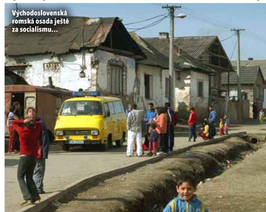
Východoslovenská romská osada ještě za socialismu...

když jsem odjel studovat do Bratislavy na filozofickou fakultu. Ten večer si dal v hospodě panáka u pultu a sesunul se na zem.